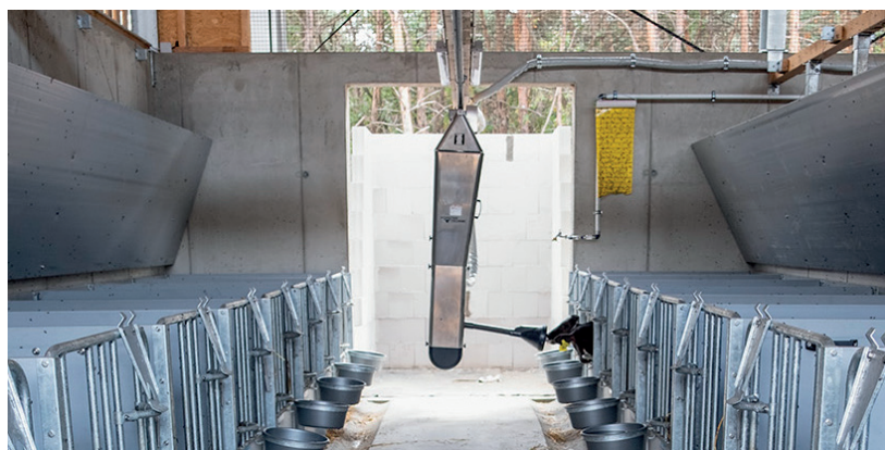
Installation de 4 unités CalfRail chez Milchgut Bahnitz GmbH

„Comme nous considérons des veaux en bonne santé et vitaux une base essentielle pour une production laitière efficace, ces dernières années, nous avons beaucoup investi dans les domaines des soins prénatals et postnatals ainsi que dans la phase précoce de l'élevage. L'introduction de l'alimentation automatisée pour 80 veaux d'élevage a permis de stabiliser l'état de santé des veaux et d'atteindre une meilleure croissance dans cette phase cruciale du développement.“