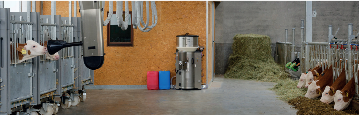
Approvisionner CalfRail et les lots avec un seul DAL