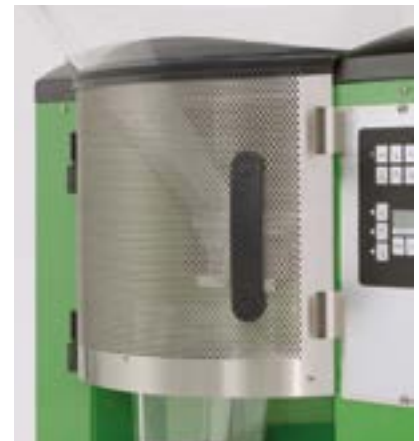
Grille de protection anti-mouches en option

La protection anti-mouches aux pores fins destinée au mixer empêche les mouches de s'introduire dans le gobelet mélangeur. Les pores et le grand volume permettent à la vapeur générée dans le gobelet mélangeur de s'échapper rapidement, ce qui évite la formation de condensation.