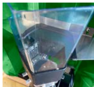
Chauffage du mixer disponible en tant qu'accessoire

Le chauffe-eau avec capteur de température, le système de régulation électronique du chauffage et la surveillance de la température minimale garantissent à tout moment la bonne température de la buvée qui peut être réglée et vérifiée simplement.