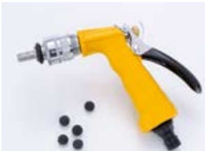
Pistolet de nettoyage des tuyaux

Le nettoyage semi-automatique du mixer est efficace et facile. Un simple bouton permet même d'avoir à cet effet de l'eau plus chaude. Le gobelet mélangeur ouvert et orientable est facile d'accès, ce qui permet de contrôler rapidement et à tout moment son fonctionnement. Vous pouvez éliminer facilement les dépôts présents dans les tuyaux d'alimentation et même nettoyer sans problème les tuyaux plus longs grâce au pistolet de nettoyage.