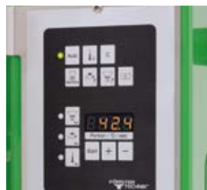
Une utilisation intuitive

Votre distributeur automatique pour agneaux et chevreaux est très simple et intuitif à utiliser grâce à son unité de commande compacte et à l'écran à 7 segments. Les quantités d'eau et de PDL peuvent être réglées séparément avec les touches de sélection directe grâce au menu des fonctions clairement structuré. Un compteur de portions permet de contrôler facilement la quantité de buvée distribuée.